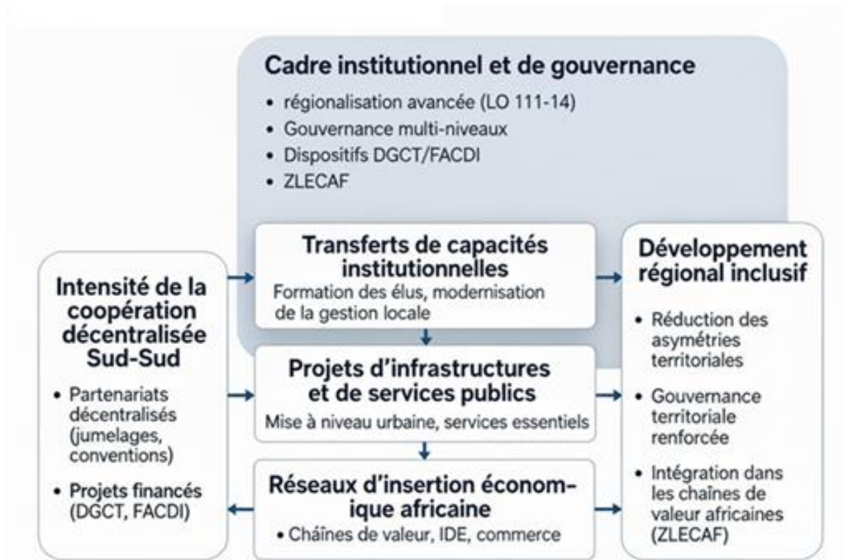
Figure 2: Modèle conceptuel du territoire coopérant africain.

Le cadre conceptuel proposé articule l'intensité de la coopération décentralisée Sud-Sud portée par les collectivités marocaines avec un ensemble de mécanismes intermédiaires et de résultats territoriaux. Il distingue, en amont, une variable explicative centrale – la densité et la structuration des partenariats décentralisés (jumelages, conventions, projets financés par la DGCT et le FACDI) – et, en aval, une variable de résultat synthétique, le développement régional inclusif, appréhendé à travers la réduction des asymétries territoriales, le renforcement de la gouvernance locale et l'intégration des régions dans les chaînes de valeur africaines. Entre les deux, trois mécanismes causaux sont identifiés : les transferts de capacités institutionnelles, les projets d'infrastructures et de services publics conjoints, et la construction de réseaux d'insertion économique continentale. L'ensemble de ces relations s'inscrit dans un cadre institutionnel spécifique, marqué par la régionalisation avancée, la gouvernance multi-niveaux et les dispositifs africains de coopération et d'intégration (ZLECAF), qui conditionnent la portée et l'efficacité des effets observés ou postulés.