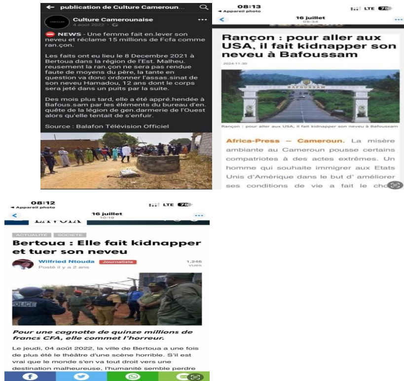
Photo 2 : Implication des proches dans les enlèvements des victimes